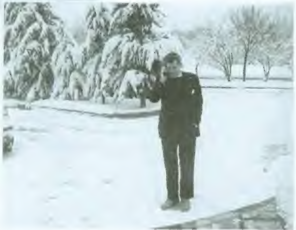
تحدّث مع مستشارة الأمن القومي كوندوليزا رايس عن كرستان